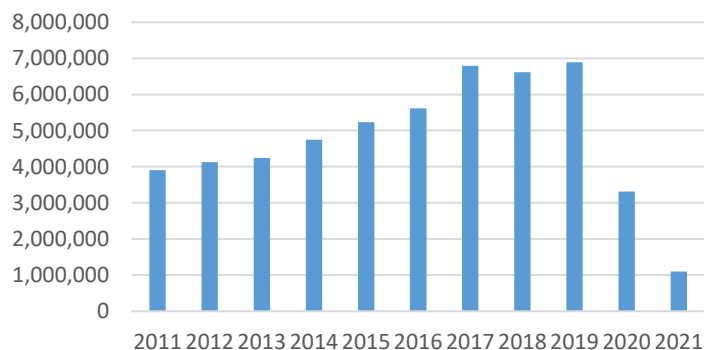
Afluencia Turística (Visitantes)