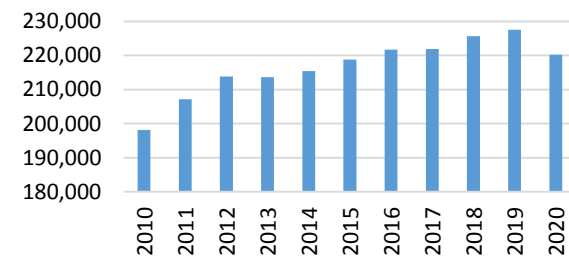
Trabajadores Asegurados al IMSS en Chiapas